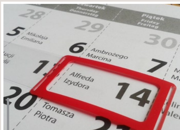
Opaska z przesuwającym okienkiem