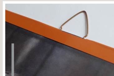
Listwa górna z zawieszka