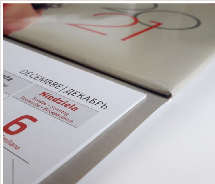
Główka: wypukła (kaszerowana) Kalendarium łączone z pleckami za pomocą kleju