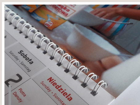
Kalendarium łączone z główką i pleckami metalową spiralą