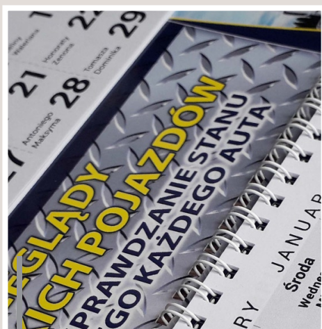
Kalendarium łączone z pleckami metalową spiralą