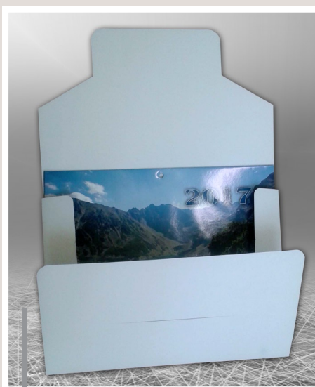
Pudełko do kalendarza