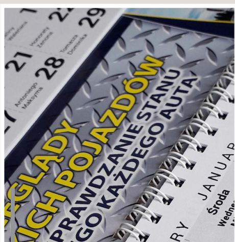
Kalendarium łączone z pleckami metalową spiralą