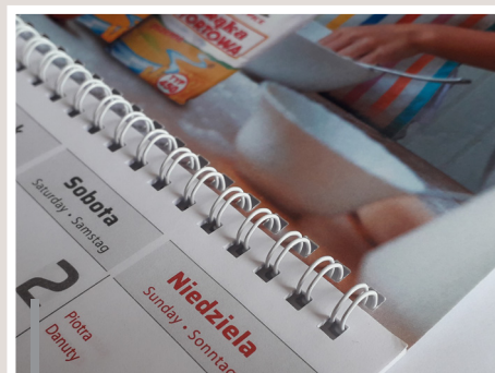
Kalendarium łączone z główką i pleckami metalową spiralą